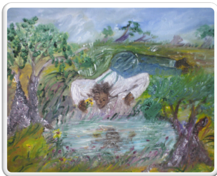
Narciso (Óleo sobre lienzo). María A. Molina Enero de 2010