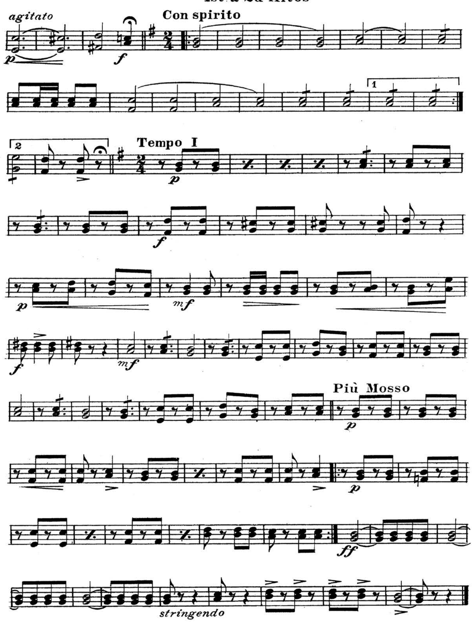
1st & 2d Altos